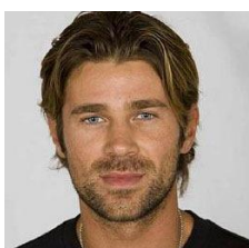
Fabio Fulco - Salvatore