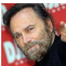
Franco Nero - Primario