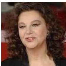
Stefania Sandrelli - Maria