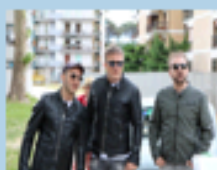
Ditele Voi - Malviventi